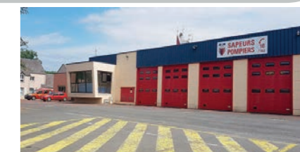
DOSSIERS À MENER AVEC COUTANCES MER ET BOCAGE